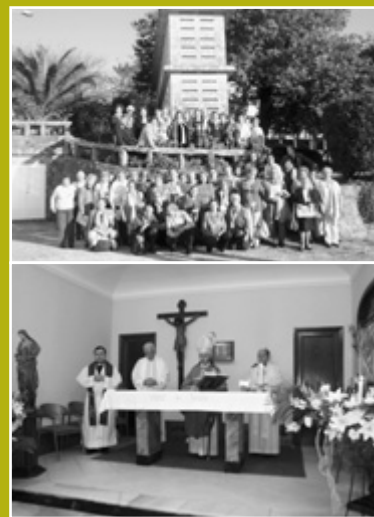
El Sr. Obispo nos honró con su presencia y sus palabras de apoyo en una emotiva Eucaristía junto a varios directores espirituales.