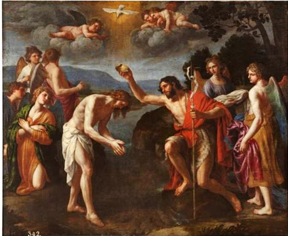
El Bautismo del Señor. Tuchi Alessandro.

Al comenzar este 2025, un año marcado por el Jubileo Ordinario y el 75º aniversario de la Legión de María en España, la reflexión sobre nuestra llamada a la misión toma un tono profundo y renovado. El mes de enero, con sus fiestas y conmemoraciones, nos ofrece múltiples oportunidades para profundizar en nuestra vocación y vivir con más plenitud la misión que hemos recibido a través del Bautismo, como nos enseñó el Señor.