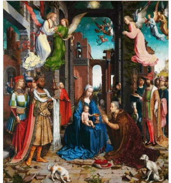
La Natividad. La Adoración de los Reyes. Jan Gassaert

Nuestra meditación navideña puede seguir en la mente y corazón de cada uno de nosotros si continuamos mirando en Cristo a cada persona llamada a ser miembro de su Cuerpo Místico que es la Iglesia. Y que esa mirada se llene de la fe profunda de María para que podamos amar con María y como María con afecto de caridad. El oficio propio de los legionarios dentro del Cuerpo místico es guiar, consolar y enseñar a los demás al identificarse con la doctrina del Cuerpo Místico guiados y enseñados por la Madre de la Iglesia que es la Madre de Jesucristo. Cristo vive en María y en la Iglesia. La Iglesia reproduce la vida de Cristo en todas sus fases y Cristo continúa mediante ella su misión sobre la tierra. María estuvo en todas las fases de la vida humana de Jesús y está presente en todas las etapas de la historia de la Iglesia. María cuida siempre del Cuerpo Místico de Cristo para que siempre pueda la Iglesia ser colaboradora dócil de Cristo, como María.