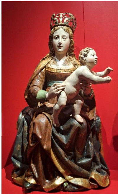
“La Virgen y el Niño”, Felipe Bigarny (taller); León Picardo, hacia 1513 Madera policromada

El capítulo 41 del Manual nos habla de la caridad, el alma de la vida cristiana, el alma de todas las virtudes. Para hablarnos de la caridad cristiana, el Manual parte de María, Madre del amor Hermoso. Tan repleta de amor estaba María, que fue hallada digna de concebir y dar al mundo a Aquel que es el Amor mismo. La Legión de María, por su devoción e imitación de María, quiere destacar por un amor idéntico al de Ella; tiene que estar repleta de caridad, y sólo así la difundirá en el mundo.