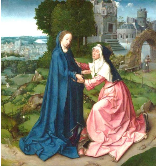
de Goossen van der Weyden, 'La Visitación de la Virgen a Santa Isabel', hacia 1516

El mes de mayo florece con una llamada a volver la mirada a María, la Virgen fiel, que acompaña cada paso del cristiano con su amor silencioso y activo. Es el mes de la Virgen y, para la Legión de María, también un tiempo de escuela espiritual y de renovación apostólica.