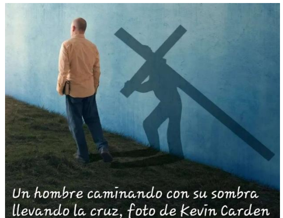
Un hombre caminando con su sombra llevando la cruz

El Papa Benedicto XVI, en una de sus homilias en Lourdes: «Este es el gran misterio que María nos confía también a nosotros, invitándonos a volvernos hacia su Hijo. De hecho, es significativo que, durante la primera aparición a Bernardita, María comienza el encuentro con el signo de la cruz. Más que un simple signo, es una iniciación en los misterios de la fe que recibe Bernardita de María. El signo de la Cruz es una especie de síntesis de nuestra fe, porque dice mucho de cómo Dios nos ama, nos dice que hay un amor en este mundo que es más fuerte que la muerte, más fuerte que nuestras debilidades y pecados. En Lourdes María invita a todas las personas de buena voluntad, a todos los que sufren en el alma o en su cuerpo, a elevar sus ojos hacia la Cruz de Jesús, con el fin de descubrir allí la fuente de la vida, la fuente de la salvación ».